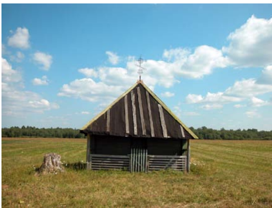
Ил №4. Часовня, неподалеку от села Керстово, поставленная при Елизавете Петровне на месте поля боя со шведами в 1703 году. 2007 год

В 1703 году "в плен" к Шереметеву, Меншикову и затем к Петру попадает Марта Скваронская. Кстати, Шереметев захватил Марту в плен подле села Керстово (Крестово), между Копорьем и Ямом (позднее Ямбургом и еще позднее - Кингисеппом). На полях подле этого села произошла одна из значительных битв, окончившаяся победой войск Шереметева. Шведский лагерь также был неподалеку от Керстово - на реке Солке. 13 Интересно, что позднее Петр дарует поместье Великино, которое также находится в тех же краях приемному отцу Марты - пастору Глюку.