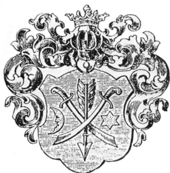
Ил № 1. Герб дворян Арсеньевых

Супруга светлейшего князя А. Д. Меншикова Дарья Михайловна, урожденная Арсеньева (Арсенева, Орсенева), родилась в день Дарьи Пролубницы в воскресенье 19 марта (29 марта по новому стилю) 1682 года в семье якутского воеводы и стольника Михаила Афонасьевича Арсеньева. 1 Дед Дарьи Михайловны – Афонасий Федорович был воеводой города Данкова. Город этот позднее перешел к А.Д. Меншикову. Род Арсеньевых восходил к знатному татарину Ослану-Мурзе Челебею, выехавшего в Россию из Золотой Орды и принявшего святое крещение с именем Прокопия в 1389 году. По родовой легенде, сам великий князь Дмитрий Донской был его восприемником от купели и выдал за него дочь своего ближнего человека Житова — Марию. 2