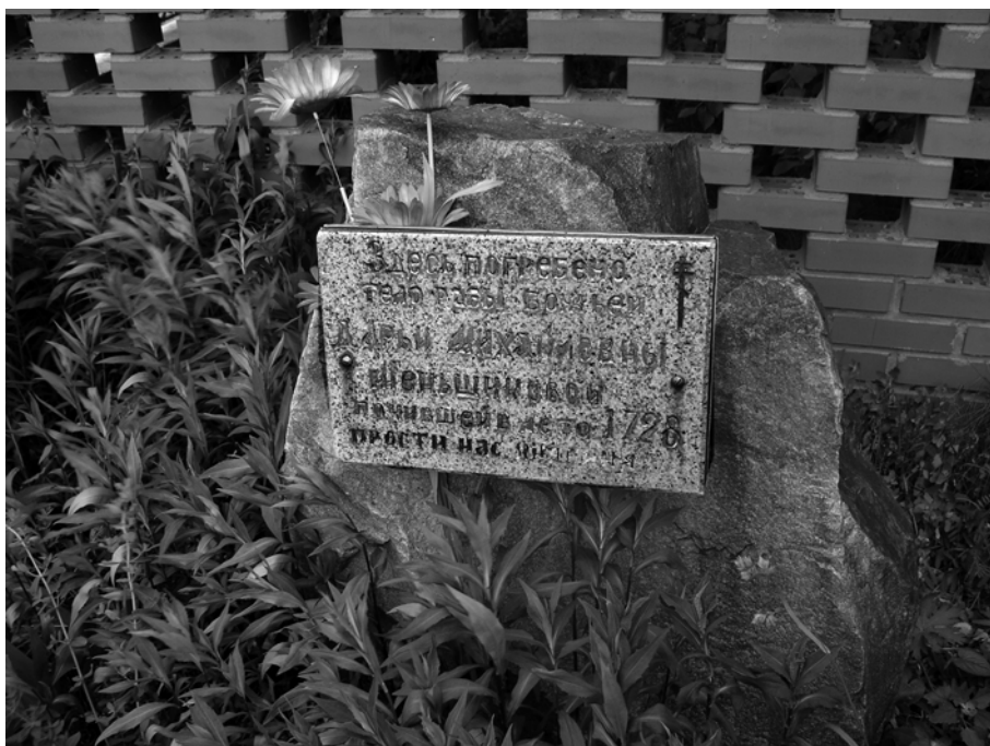
Ил.№8. Надгробный камень с могилы Д.М. Меншиковой с надписью воспроизведенной на отдельной доске, в ограде храма Св. Николая Чудотворца в селе Верхний Услон. Фото Э.Левиной по заказу автора 2009

До постройки часовни, надгробный камень, открытый ветрам дождю и снегу лежал в саду местного дьячка. В описании начала XIX века говорится, что "крапива и полынь покрывает его".