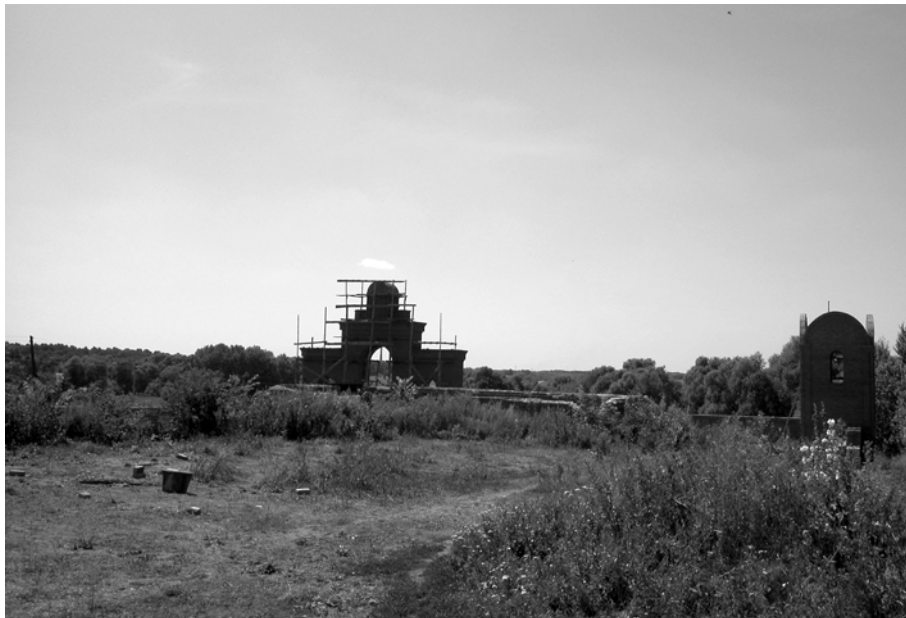
Ил.№6. Развалины монастыря во имя Св. Петра и Павла, заложенного А.Д. Меншиковым 28 июля 1712 года в Раненбурге.