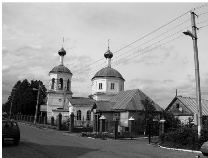
Ил.№7. Церковь Св. Николая Чудотворца в селе Верхний Услон. Фото Э.Левиной по заказу автора, 2009

Где же была расположена могила Дарьи Михайловны и какая судьба ее постигла?