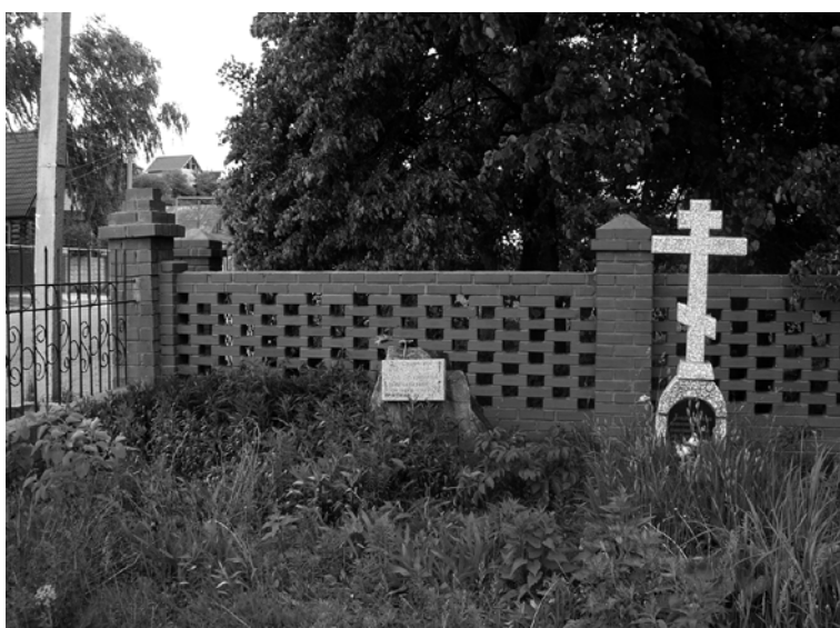
Ил.№.11 Расположение могильного камня в ограде церкви Св. Николая в селе Верхний Услон.