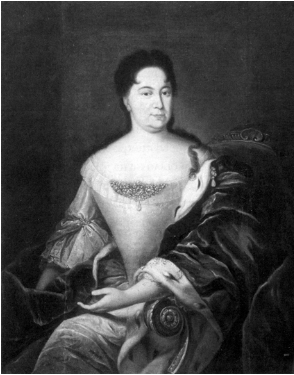
Ил.№2. Портрет Дарьи Михайловны Меншиковой из книги «Петр Великий» Роберта К. Масси Неизвестный мастер начала XVIII века

Дарья Михайловна поступила на службу «в комнаты» царевны Натальи Алексеевны в 1688 году, где находилась вместе со своими сестрами. Ее самая известная сестра Варвара была настолько же умна и проницательна, насколько имела некрасивую фигуру (родовая травма?). По преданиям, она была известной травницей и знахаркой. Считается, что она передала свои знания Марии Меншиковой. По непроверенным пока данным, одна из известных рукописных тетрадей-травников XVIII века, сохранившихся в фондах Национальной Публичной библиотеки