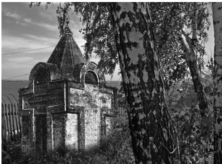
Ил.№ 9. Реконструкция местоположения часовни Д.М. Меншиковой в селе Верхний Услон. Монтаж автора.

- Александр Александровичу Анной Иоанновной ), представляла собой квадрат в плане размером не более 2,5 x 2,5 метра. Каждый фронтон имел вид креста, с полукруглой вершиной, представлявшей собой полукруглые же оконца с ромбовидной расстекловкой. Шатер кровли был шестигранный, увенчанный кованым из прута крестом на шаре. По углам кровли имелись воронки для сбора дождевой воды и металлические водосточные трубы до низа перекладин "крестов на фасаде".