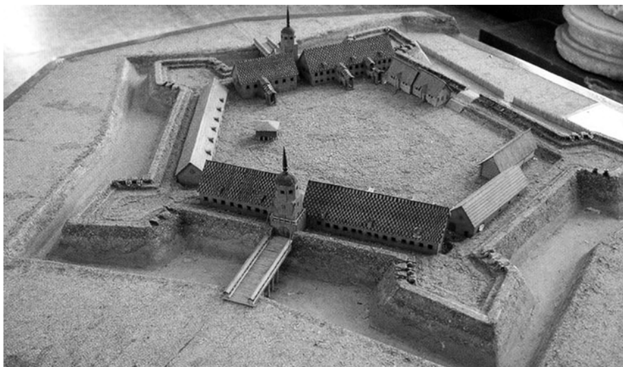
Ил.№5. Реконструкция Раненбургской крепости времен ссылки А.Д.Меншикова в краеведческом музее г. Чаплыгина. Фото автора 2007

Гнилой Березов, с лишением чинов и состояния. За подробной исторической информацией об этих событиях автор отсылает читателей к работе Г.В. Есипова "Ссылка князя Меншикова", опубликованной в «Отечественных записках», № 8 за 1860 год и в №№1 и 3 за 1861 год.