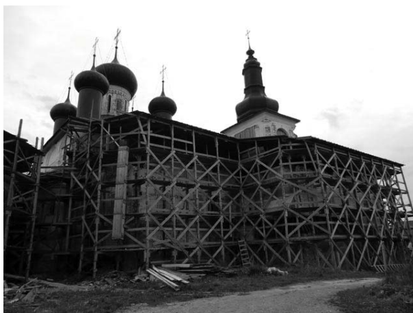
Вид на северные приделы Св Великомученицы Екатерины и Дмитрия Царевича к собору во имя Воскресения Христова.